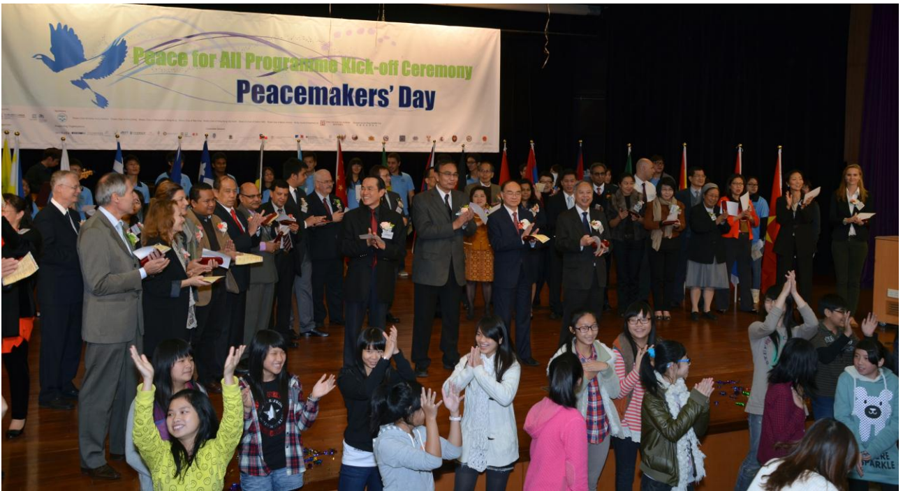
逾 500 人出席在教院大埔校園舉行的「和平大使日」開幕禮，攜手宣揚和平和多元文化的精神，推動對不同傳統習俗的相互理解和尊重。